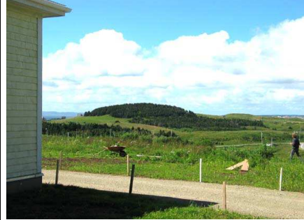
Vue arrière – Paysage maritime