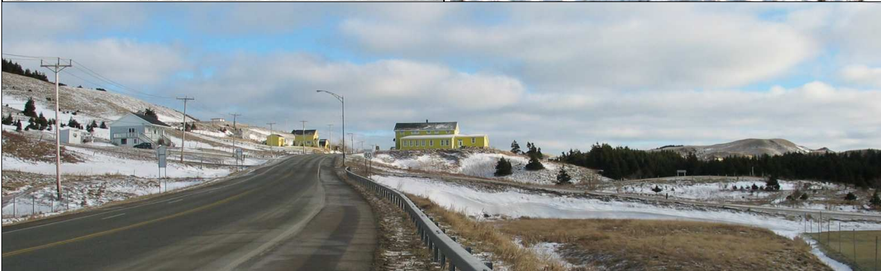
L'école Saint-Joseph et sa situation dans le paysage de Havre-aux-Maisons