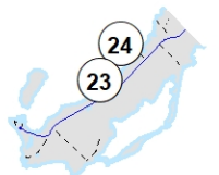
Île de la Grande Entrée