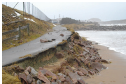
Avant la mise en place du rip-rap en 2012

À la suite de la tempête de décembre 2010, la Municipalité des Îles-de-la-Madeleine craignait que les étangs aérés, fortement affectés par l'érosion, se déversent à la mer. Un rip-rap d'urgence a donc été construit avec de la pierre locale, sur une distance de 100 mètres et au coût de 200 000 $. L'ouvrage avait une durée de vie estimée à l'époque à environ 5 ans. Il s'agissait donc d'une mesure temporaire, qui nécessiterait un jour des travaux plus costauds pour assurer une protection à plus long terme.