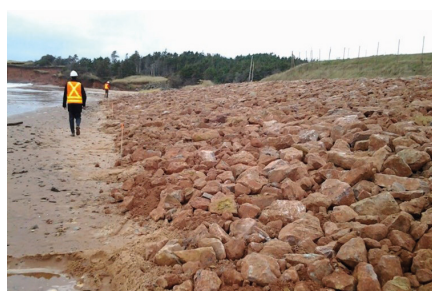
Après la mise en place du rip-rap en 2012