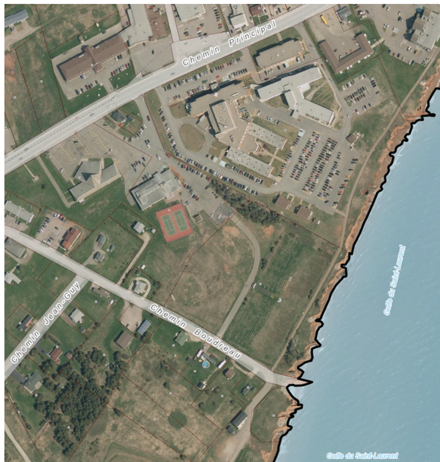
Photo aérienne - 2015

Une panoplie de renseignements qui peuvent également être imprimés si, bien entendu, vous disposez d'une imprimante. Voici une façon simple et efficace de vous éviter un déplacement à la mairie. Par ailleurs, une fois que vous aurez pris connaissance des données disponibles sur le site Web, si vous avez des questions en lien avec le cadastre ou le zonage, vous pourrez communiquer avec le Service de l'aménagement du territoire et de l'urbanisme et, au besoin prendre rendez-vous avec un inspecteur municipal qui saura assurément répondre à vos interrogations.