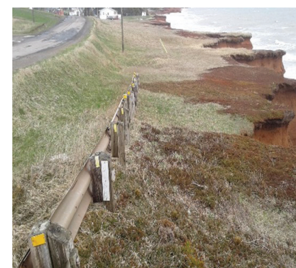
Le chemin Gros-Cap

Ainsi, considérant le nombre élevé de sites qui nécessiteront des interventions à court, moyen et long terme, le conseil de la Communauté maritime a décidé d'adresser une demande particulière et spécifique au gouvernement du Québec. Cette demande d'un montant de 80 M$ sur 10 ans a suffisamment fait échos à Québec pour que la présidente de la conférence administrative régionale des Îles-de-la-Madeleine, soit mandatée pour aider la Communauté maritime à préciser sa demande. Le travail avance bien et nous avons bon espoir que cette démarche, malgré son caractère particulier et hors norme, pourra éventuellement donner les résultats escomptés.