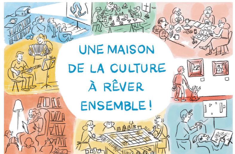
Illustration : ©Cyril Doisneau

Vous pouvez continuer de contribuer à ce projet important pour la communauté des Îles en inscrivant vos idées, suggestions ou commentaires sur les cartes postales disponibles à la mairie, à la Bibliothèque Jean-Lapierre et ses points de services ainsi qu'au Centre Multisport Desjardins. Vous pouvez également remplir le formulaire disponible au www.muniles.ca .