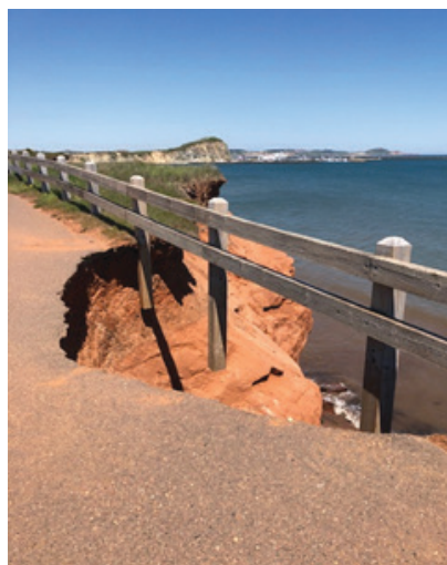
Sentier cyclopédestre Cap-aux-Meules