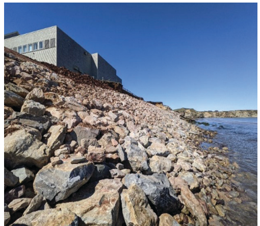
Ouvrage de protection du cinéma Cyrco

La Communauté maritime a bon espoir que tout ce travail porte ses fruits et qu'il continuera de profiter non seulement à la population des Îles, mais aussi à toutes les communautés québécoises qui vivent et subissent les impacts négatifs de l'érosion et de la submersion côtière.