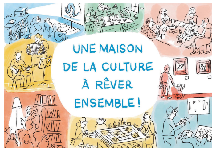
Illustration : Cyril Doisneau

La Municipalité des Îles vous invite à contribuer au projet de développement de la Bibliothèque Jean-Lapierre et de la Maison de la culture.